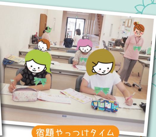
宿題やっつけタイム